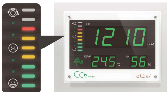
視認性に優れた LED インジケータで CO 2 濃度を 9 段階で表示します。