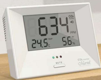
■マーベル 001 / 003

長期間使用時にも、測定誤差の生じにくい 高精度光学式 NDIR デュアルビームセンサーを使用